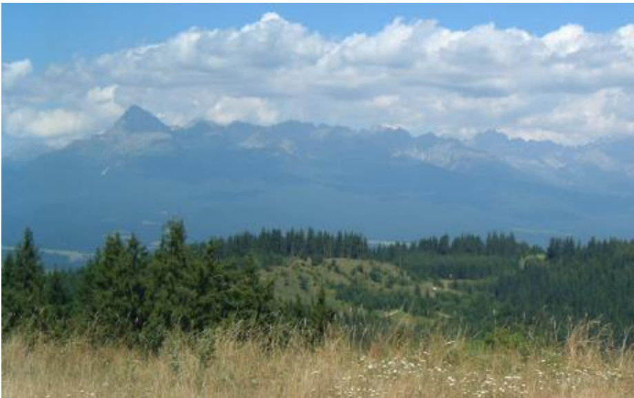
Ilustrační

Predseda Združenie certifikácie lesov Slovenska